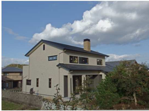
煙突が外壁のアクセントになっています。

玉川町で建設中の3世代同居の2世帯住宅です。デュアルリビングにバリアフリー等級の取得、基準法を大幅に上回る耐震性、吹付断熱などなど、次号で完成写真と詳細をお伝えできると思いますが、まずは奥様がこだわられた外壁と薪ストーブが設置されるリビングの吹抜けの様子をご紹介します。